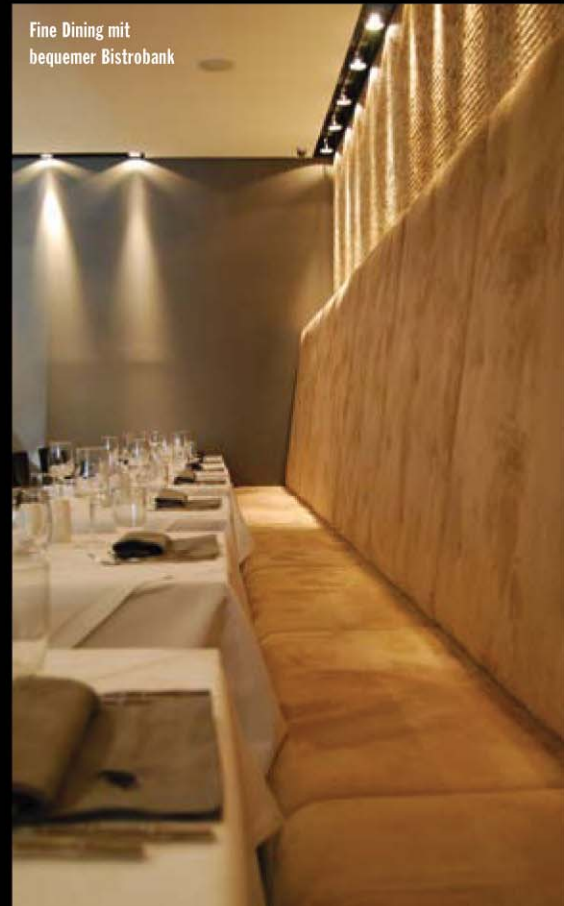
Fine Dining mit bequemer Bistrobank

Vielseitigkeit zeichnet das RAVEN aus. Neben dem À la Carte Geschäft sind vor allem die wöchentlich wechselnde Mittagskarte, der allsonntägliche Brunch, sowie spezielle Angebote wie z.B. Weihnachtsmenü und saisonale Köstlichkeiten die Highlights.