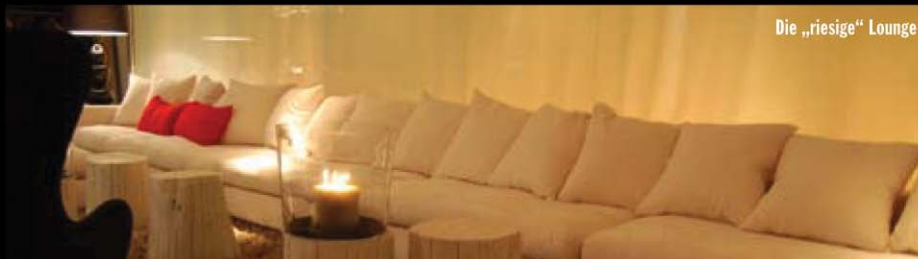
Die „riesige“ Lounge