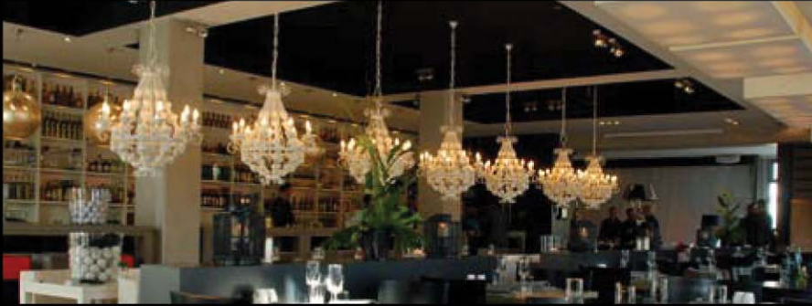
Bild links: der Bistrobereich. Bild rechts: die Lounge mit behaglichem Sofa und Sesseln.

Die räumliche Gestaltung im RAVEN ist einzigartig und neu. Der moderne Raum wird durch verschiedene Bereiche intelligent und funktional aufgeteilt. Betritt man das RAVEN, so ist die lange Bar der erste Blickfang im Restaurant. Mit einem Rückbuffet, das bis zu 2000 Flaschen beherbergen kann und einer Länge von achtzehn Metern muss das hochqualifizierte Barteam keinen Beweis mehr antreten, dass hier nur gute Drinks kreiert werden.