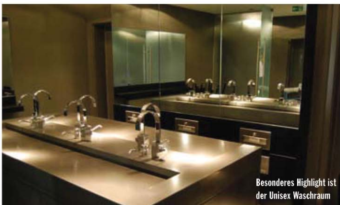
Besonderes Highlight ist der Unisex Waschraum