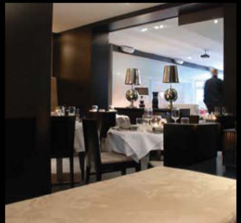
Bild links: die extralange Bar. Bild oben: der Fine Dining Bereich ist auch separat zu buchen.