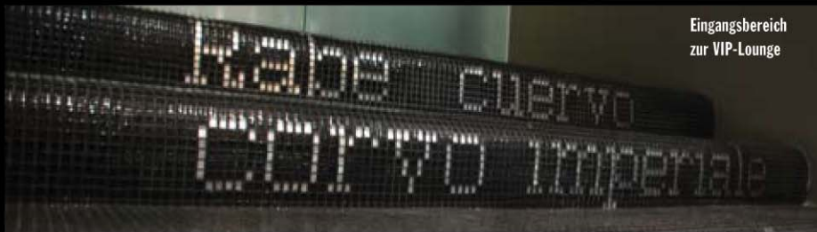
Eingangsbereich zur VIP-Lounge